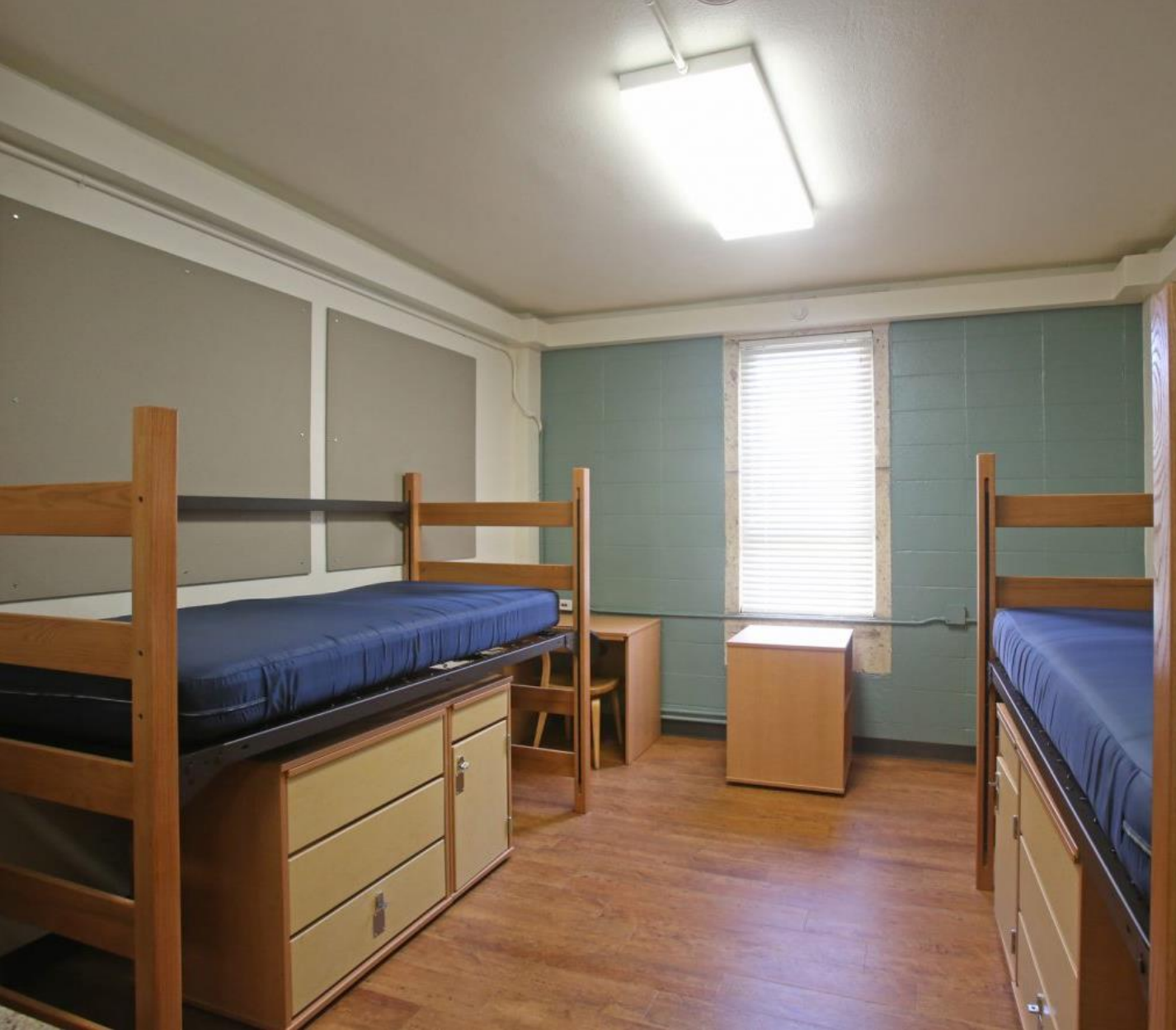
la résidence universitaire